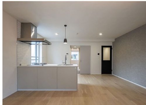
【「GranDuo 駒沢 11」外観・内観】

本物件は、東急田園都市線「駒沢大学」駅から徒歩10分の駒沢エリアに位置し、国内3大ビッグターミナルとして知られる「渋谷」へのアクセスが良好という抜群の利便性でありながら、駒沢オリンピック公園などの緑豊かな街並みに佇む物件となっています。