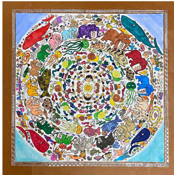
最優秀賞「地球のみんな」