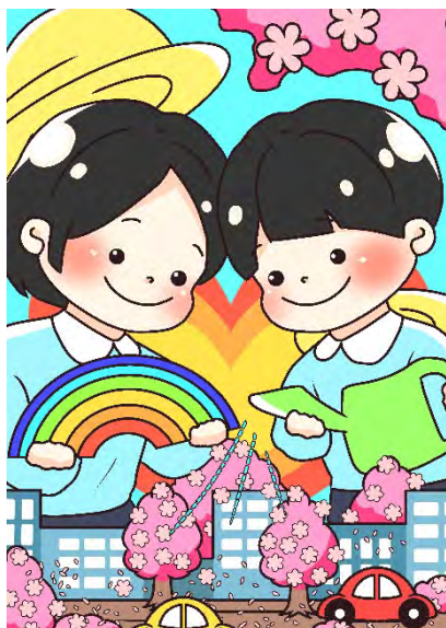
入賞「この街を咲かすヒーロー」 NATSUKO 作