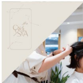
AI診断とスタイリストのカウンセリングで最適な処方を導きます。