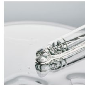
14種の植物成分に、効能度美容液成分、ビタミンC誘導体を配合