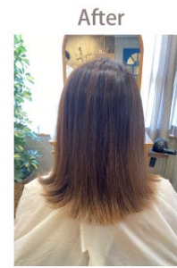
髪のバサつきが気になる30代女性 →髪がうるおい、カラーの落ち着きまで見られた