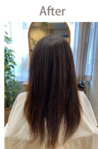
髪の広がり＆うねりがある40代女性 →髪が落ち着き、ストレート効果も