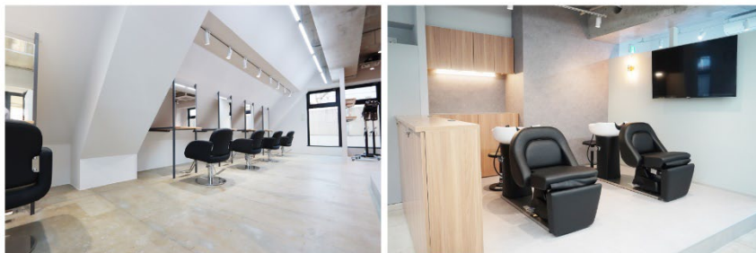
【中目黒店 内観写真】