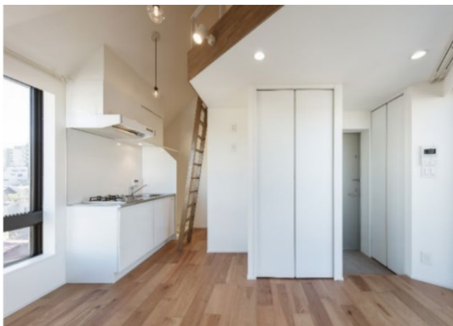
【物件内観】（物件写真は竣工時に撮影）