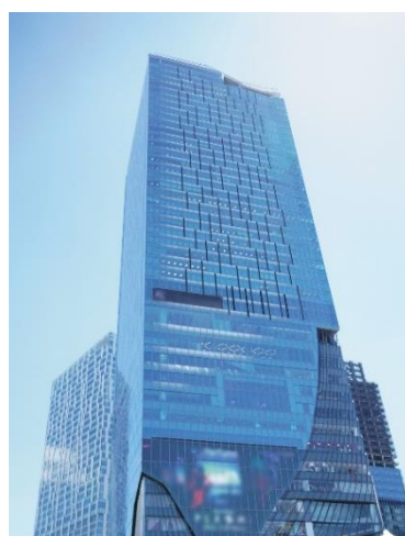
【渋谷スクランブルスクエア】