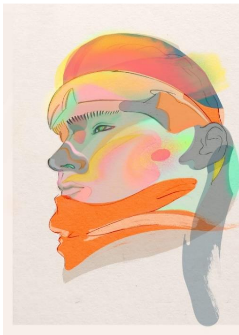
入賞「nostalgia」 Junsei 作