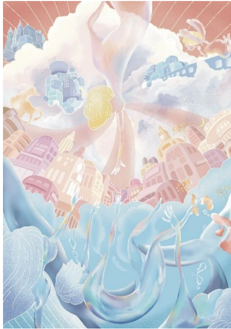
入賞「幕開け」 AKANE 作