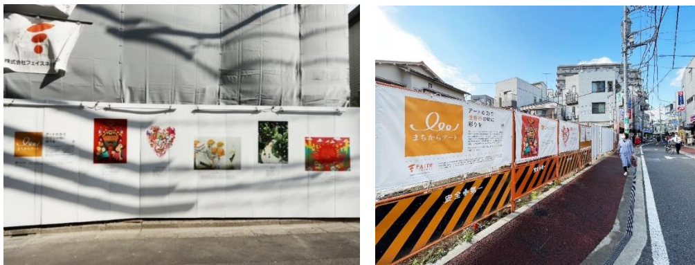
【前回コンテストの当社建築現場作品展示の様子】

※仮囲いとは、建築現場において、防犯や安全、防塵、遮風、遮音目的で工事期間中の工事現場と外部を遮断するために設けられる防護板のこと