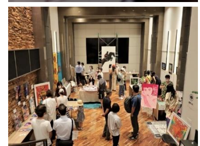
【まちからアート展開催の様子】