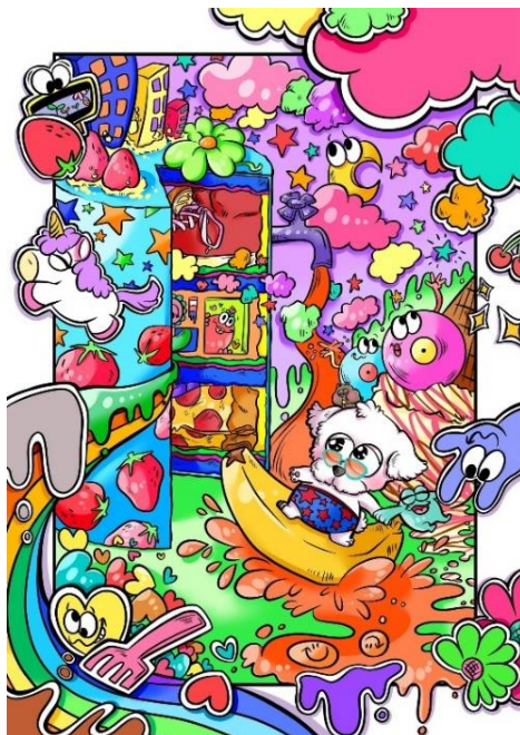
入賞「PaRK」 karegon. 作

故郷を離れた少年が変わっていく生まれた地を思い、寂しくも嬉しく思う気持ちを表現したく、制作させていただきました。