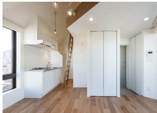
【物件内観】（物件写真は竣工時に撮影）