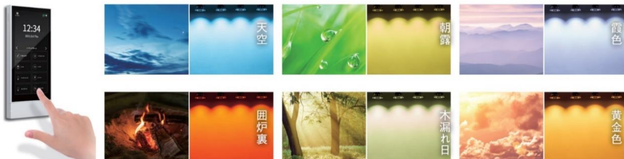
※遠藤照明「次世代調光調色シリーズ Synca（シンカ）」商品説明より

導入設備：「次世代調光調色シリーズ Synca」「無線調光システム Smart LEDZ」