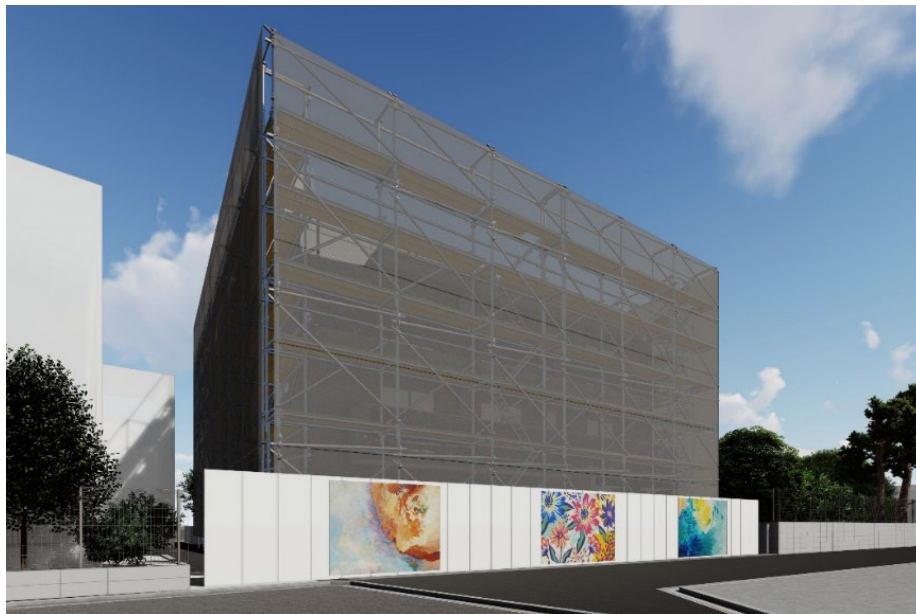
【アート作品展示イメージ】

※仮囲いとは、建築現場において、防犯や安全、防塵、遮風、遮音目的で工事期間中の工事現場と外部を遮断するために設けられる防護板のこと