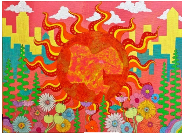
入賞「Sun-day」 IAMYURIE 作

自然の豊かさが世田谷区の素敵なおところだと思うので、みっちりした木々と舞い上がる桜の花びらを描きました。こもれびや電車が引く明るい道で「あっちの方に行ってみたいな」とついみんなが思ってしまうまちの魅力を表現できればと思っています。建設現場は視覚的に無機質になりがちかと思うので、この絵を見てくださった方が緑豊か・光あふれる景色を想像して、自然の和みを感じていただけるととても嬉しいです。