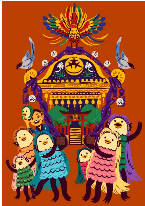
最優秀賞「おみこしわっしょい」