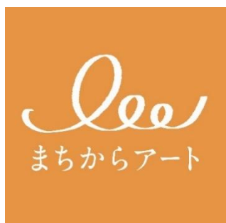
【まちからアート 公式ロゴ】

今回は、アート分野の取り組み第一弾として、「まちからアート Vol.1 仮囲いデザインのアイデアコンテスト」を開催いたします。同コンテストは、次世代を切り開くアーティストの応援と、アートによる工事現場の彩り、世田谷の賑わい創出を目的としており、東京都内在住・在勤・在学の29歳以下の若者を対象に、アート作品の一般公募を行います。受賞した作品は、世田谷区内の当社物件建設現場の仮囲いに展示いたします。