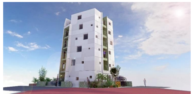
【『GranDuo 三軒茶屋 7』 外観イメージ】