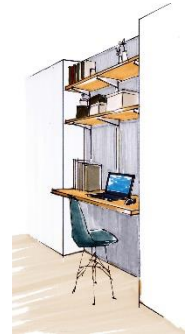
【備え付けデスクイメージ】

壁式構造を採用することにより、高い品質の躯体を短い工期で建てるのが可能となり、工事費用のコスト削減を図ることができます。圧縮した工事費用を物件の設備や内装等の費用に上乗せすることにより、物件全体のグレードを向上させることができます。さらに、今回建築予定の『GranDuo 三軒茶屋 7』では、コロナ禍によるニーズの高まりに応じて、テレワーク仕様の備え付けデスクも一部住居で導入する予定です。