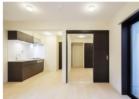
【物件内観】（物件写真は竣工時に撮影）