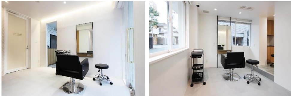
▲2面追加された新しいセット面（「GrandStory SALON」千駄ヶ谷店）