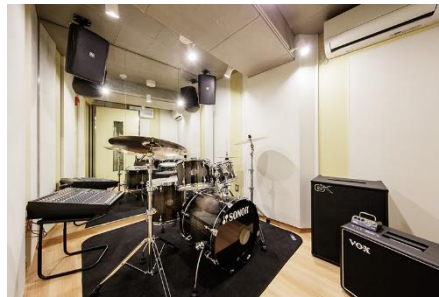
③リハーサルスタジオ