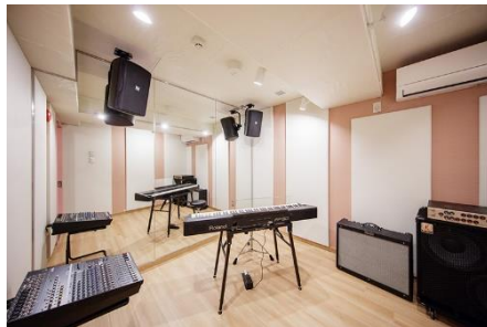
⑤リハーサルスタジオ