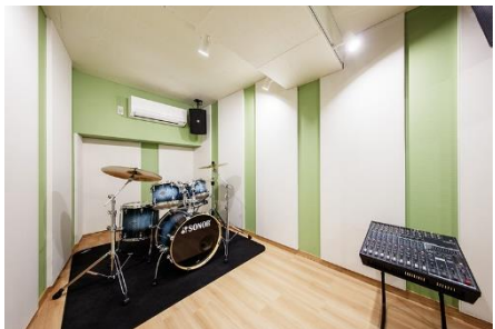
④リハーサルスタジオ