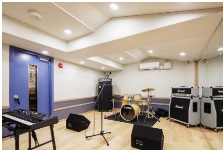
②レコーディングスタジオ