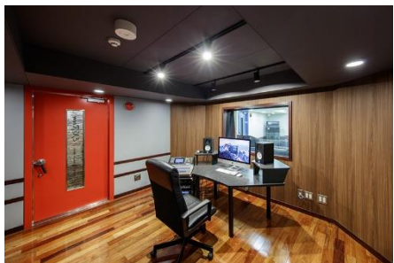
①コントロールルーム