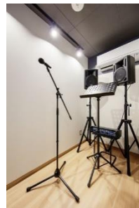
⑥リハーサルスタジオ