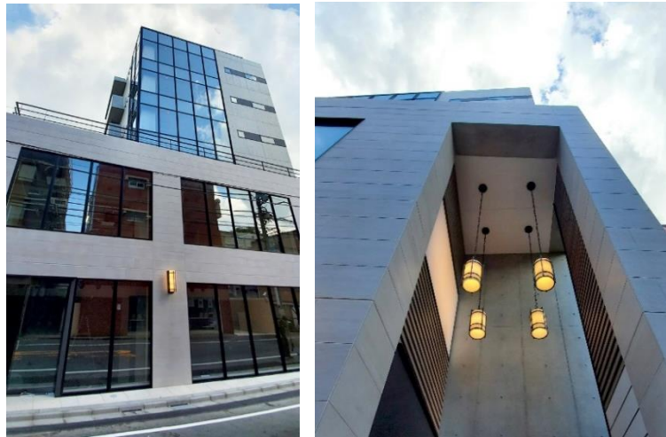
【「GranDuo 神山町」外観・エントランス】

外観デザインは、下層階に大判タイルとエッジの効いた額縁サッシを採用し、繊細で風格ある印象を与えます。対して、上層階はコンクリート打放しとガラスカーテンウォールというモノトーンなデクスチャで構成し、クールな印象を演出しています。下層階・上層階の外観デザインに意図的なコントラストをつけることで、建物に表情を与えています。