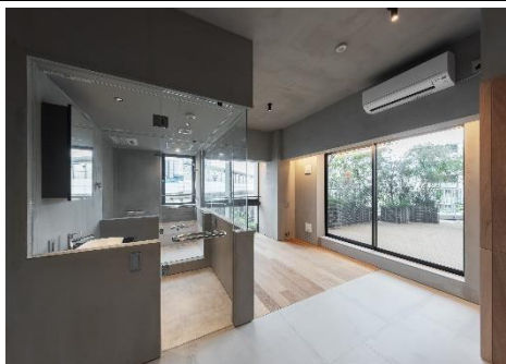
【ガラス張りの水回り】

“セメント板”と“フローリング”という異なる材料を使用することで、クラシカルでありながらモダンな室内空間をつくりだしています。“カチオン”という、本来は下塗り・下地調整剤として使うものを壁面と天井の仕上げ材で使用し、左官仕上げのもつあたたかな雰囲気 연출しました。