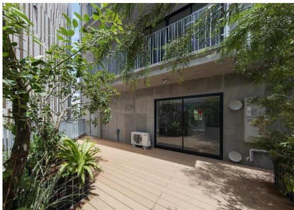
【4F ルーフバルコニー】