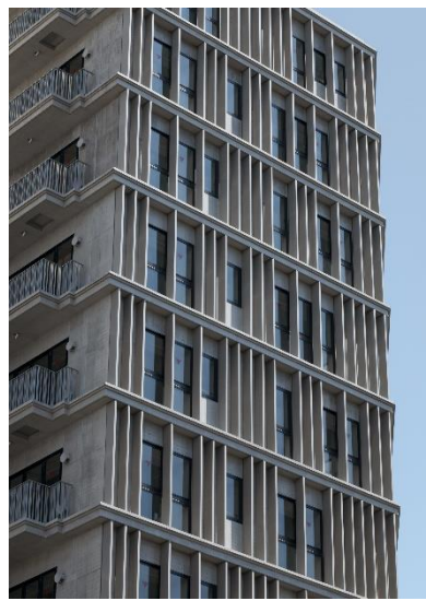
【下層階・上層階のコントラストが美しい外観】

下層階にはアイレベルで自然が感じられるように植栽が配置され、街との調和を目指しています。外壁にあるコンクリート製の“ルーバー”によって建物に陰影が施され、無機質ではない表情のある外観デザインになっており、遮音・日射の抑制がなされることで、入居者が心地よく過ごせるようにも配慮されています。