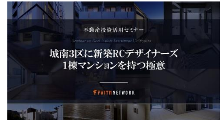
※セミナー資料イメージ